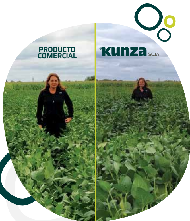
COMPARACIÓN DE CULTIVOS EN SUELO FÉRTIL